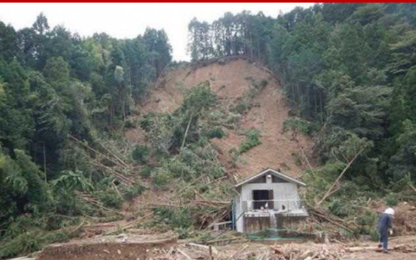
Oktubre 2014 Ang bundok ay gumuho dahil sa bagyo (Lokasyon: Lungsod ng Shizuoka)