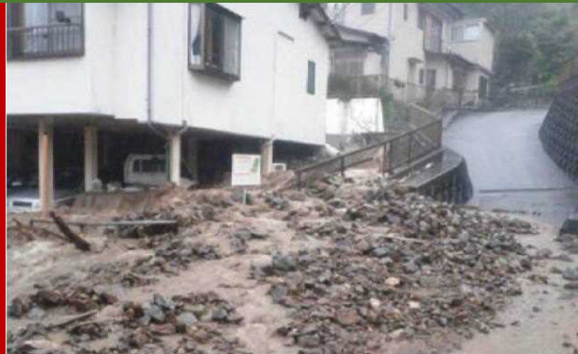
Abril 2017 Umagos na putik at bato sa kalsada (Lokasyon: Lungsod ng Shimoda)

Sa Hapon, ang malakas na pag-ulan ay maaaring magdulot ng pagguho ng mga bundok at pag-agos ng putik at mga bato patungo sa mga kabahayan at kalsada.