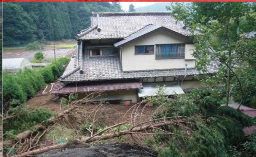
Setyembre 2010 Dumaloy ang putik at mga bato sanhi ng bagyo (Lokasyon: Bayan ng Oyama)

Shizuoka-ken Keizai Sangyou-bu Shinrin・ringyou-kyoku Shinrin Hozen-ka 静岡県 経済産業部 森林・林業局 森林保全課