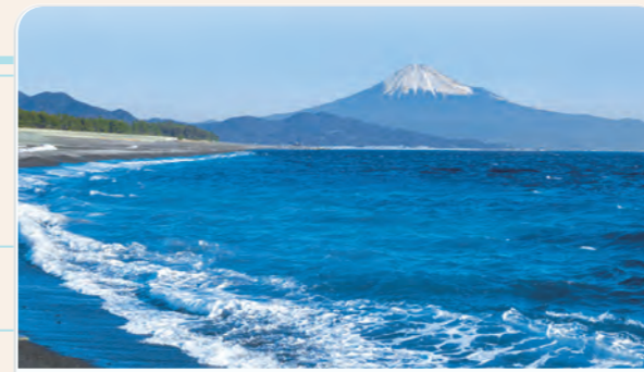
5 Mt. Fuji

Mt. Fuji is the highest mountain in Japan and is 3,776 meters high. It became a World Heritage Site in 2013 for its beauty and cultural significance, together with the Pinery of Miho (Miho-no-matsubara) in Shizuoka City.