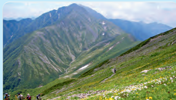
3 Minami-Alps Biosphere Reserve

Hamanako Garden Park is a park by Lake Hamana. You can view the lake from the fifty-meter-high lookout. You can enjoy flowers and gardens the whole year. You will see why Shizuoka is called "the place of flowers."