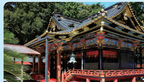
4 Kunozan Toshogu Shrine

Minami-Alps means "Southern Alps" in English. It has several mountains over 3,000 meters. It has a lot of valuable natural resources, and is home to many rare plants and animals. The Minami-Alps became a Biosphere Reserve in 2014.