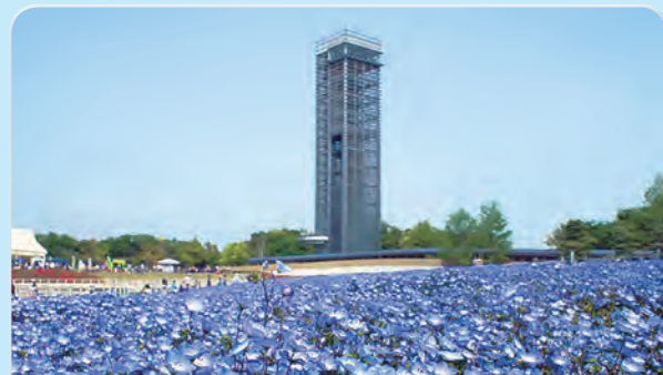
2 Hamanako Garden Park

Hamanako Garden Park is a park by Lake Hamana. You can view the lake from the fifty-meter-high lookout. You can enjoy flowers and gardens the whole year. You will see why Shizuoka is called "the place of flowers."