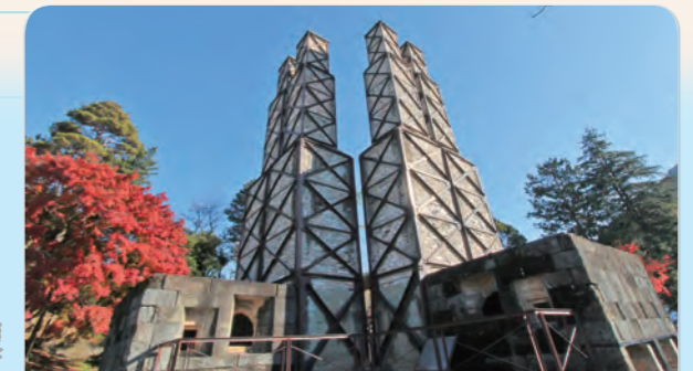
7 Nirayama Reverberatory Furnaces

The Kunozan Toshogu Shrine is dedicated to the Shogun Ieyasu Tokugawa. It was built using the latest techniques at the time, and was named a national treasure in 2010. The museum has many national treasures and important cultural properties.