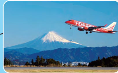
SHIZUOKA is here. Mt. Fuji Shizuoka Airport