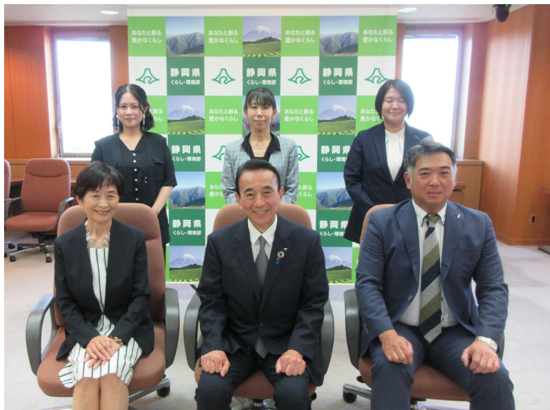
【令和6年度受賞者の皆様】