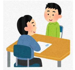
県内の保護司数と充足率

①地域で保護観察官と協働して、保護観察を受けている方と面接を行い、指導・助言をする、②刑務所などに入っている方の就労先や就学先の調査等を行う、③犯罪予防活動を行うことが主な職務です。