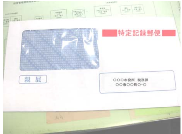
【特定記録郵便を利用】