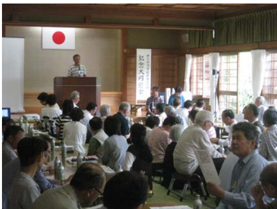
生徒はなんと100名以上！当日はOBの方も参加し、全員が先生になり授業を行いました。 授業は、紙芝居があったり、道具を使ってみたり楽しい事業がいっぱい！