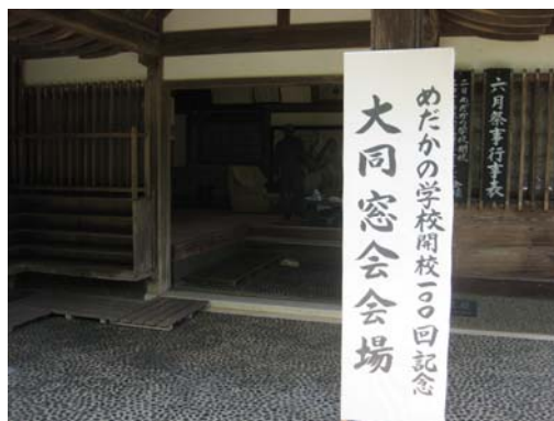
100回記念は「大同窓会」と称して 周智郡森町にある小國神社で行われました。