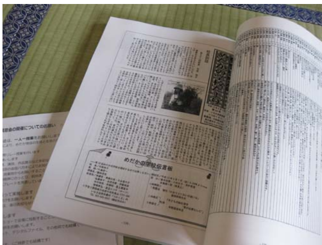
1回目の授業からすべてが掲載されている記念誌が発行されました。団体の歩みはもちろん、生徒さんたちの成長も見ることができます。