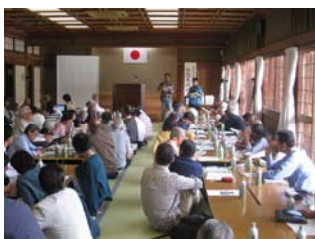
生徒のみなさんは、先生の話真剣に聞いています。