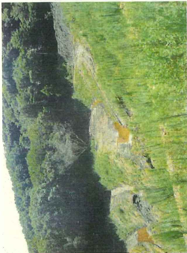
排水状況が悪く、小段の上に水たまり、左岸側に水みち、崩壊が見られる