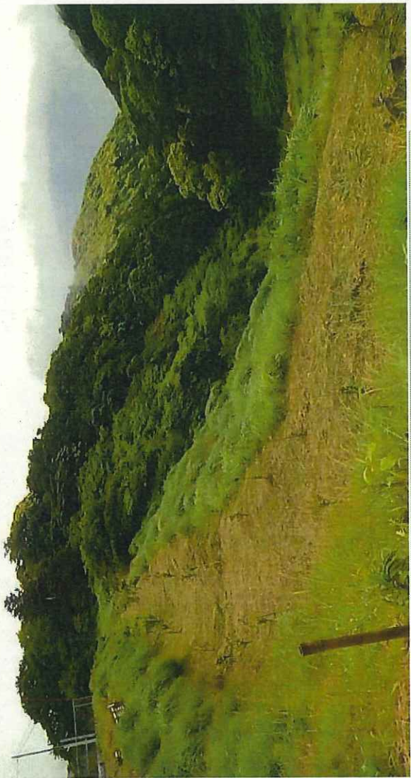
2017（平成29）年5月24日 現地調査