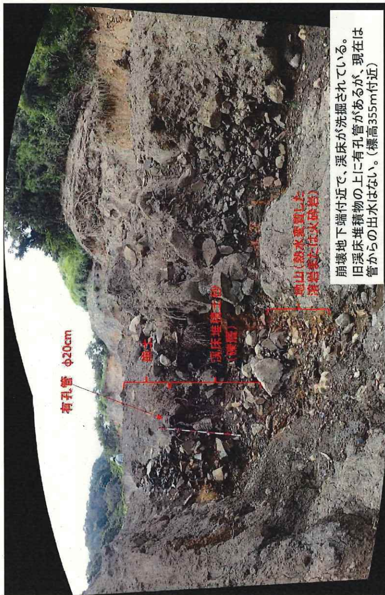
崩壊地下端付近で、溪床が洗掘されている。 旧溪床堆積物の上に有孔管があるが、現在は 管からの出水はない。(標高355m付近)