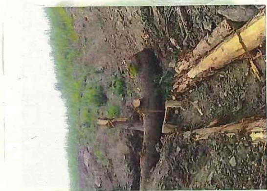
上部砂砂如 水路接続