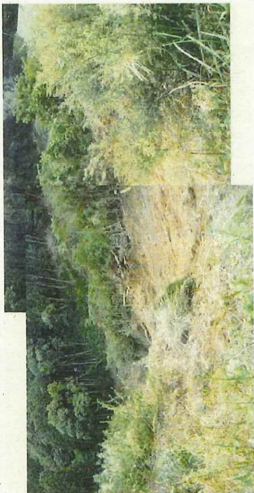
盛土左岸側の上部が大きく崩壊したものである。