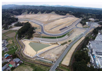
磐田市下野部地区 産業集積区域（磐田市）