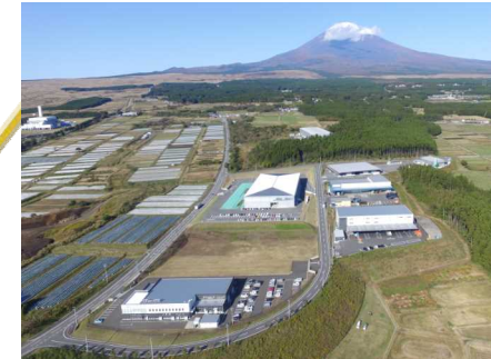
富士山東麓エコガーデンシティ地域循環共生圏 （御殿場市、小山町、裾野市）