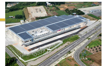
長泉沼津IC周辺 物流関連産業等集積区域（長泉町）