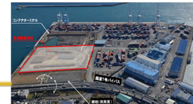
清水港新興津地区 物流拠点整備推進区域（静岡市）