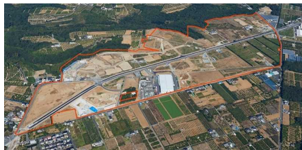
「未来創造『新・ものづくり』特区」 新・産業集積促進区域（浜松市）