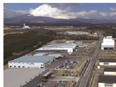
環境重視型工業団地

※裏面の「利子補給制度の具体的な事業項目」に該当し、かつ特区の数値目標の達成に寄与する事業に限る。 ※具体的な対象地域は静岡県HP ( https://www.pref.shizuoka.jp/kensei/keikaku/frontier/1011490.html )に掲載。