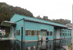
農産物加工施設の整備

※概ね東名高速道路以南、又は東海道本線・新幹線以南。伊豆半島地域にあつては、想定津波浸水域周辺等の沿岸部。