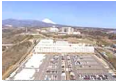
研究開発施設の整備

・三島市、函南町、長泉町、小山町、静岡市、島田市、藤枝市、袋井市、森町、御殿場市、浜松市における指定された区域