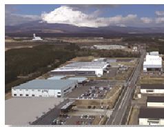
環境重視型工業団地

※裏面の「利子補給制度の具体的な事業項目」に該当し、かつ特区の数値目標の達成に寄与する事業に限る。 ※具体的な対象地域は静岡県HP ( https://www.pref.shizuoka.jp/kensei/keikaku/frontier/1011490.html )に掲載。