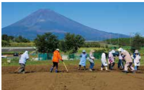
「裾野市パノラマロードを花でいっぱいにする会」の活動は耕うん、種まき、草刈りなど、一年中行われている。

パノラマ遊花の里 静岡県裾野市須山地区 パノラマロード 裾野市運動公園付近から国道469号線あたりまで 〔駐車場〕あり 〔問い合わせ先〕 裾野市役所 産業部 農林推進課 静岡県裾野市佐野1059番地 055-995-1823 http://www.city.susono.shizuoka.jp/ 東名高速道路・裾野ICより車で約6分