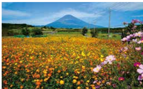
秋にはコスモスの花が咲き誇る。