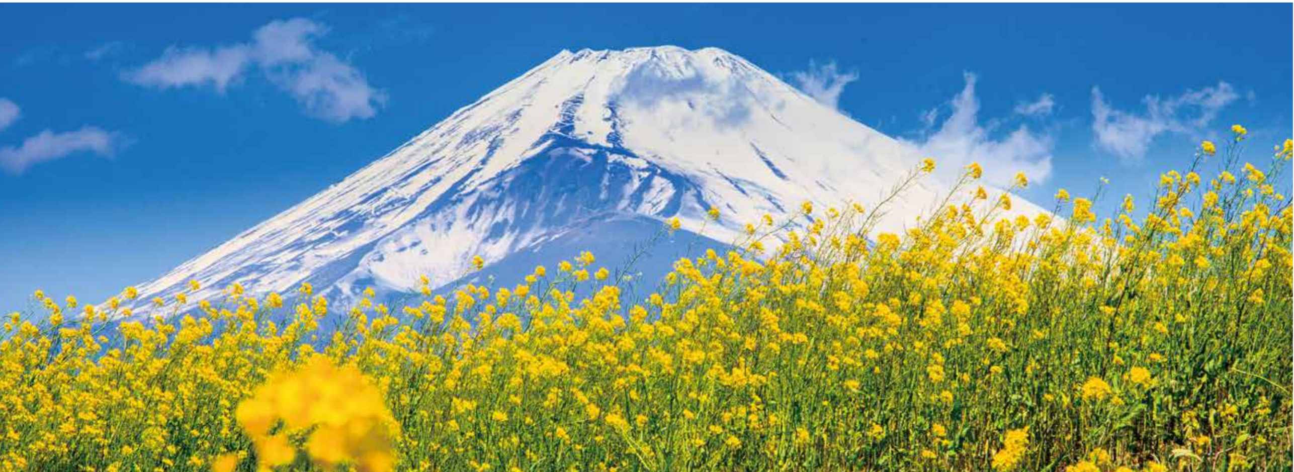
パノラマ遊花の里から見る富士山と菜の花。最盛期は約100万本の花が咲く。

富士山が眼前に迫る裾野市の須山地区には、地元の人々が古くからパノラマロードと呼ぶ全長約4.5キロメートルの市道がある。視界が大きく広がる治道には、雄大な富士山が正面にそびえ、四季の花々が周囲を覆い尽くすように咲き誇っている。