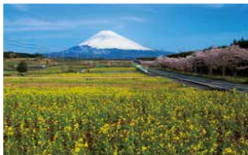
菜の花と桜を同時に楽しめるパノラマロード。