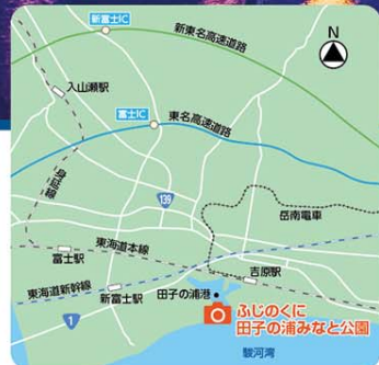
※駐車場の利用は午後5時までです(夜間利用不可)

「工業のまち」富士市には幅広い業種の工場が立地しており、ノーベル化学賞を受賞された吉野彰さんは同市にある研究所に10年勤務していました。夜になると工場に明かりが灯り、雄大な自然と人工物が織り成す幻想的な光景が現れます。静岡県の産業を支える光は、今日も力強く富士市の夜を彩ります。