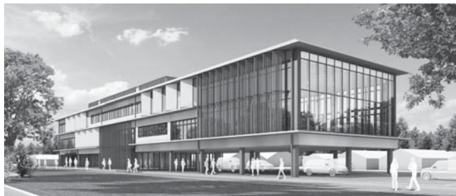
新校舎のイメージ(令和3年4月供用開始予定)

現在、令和2年度入学生を募集しています。農林業を志す高校生の皆さん、ぜひ本学に入学して、自らの夢の実現にチャレンジしてください。