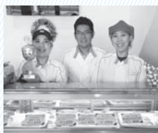
麦豚：麦を中心とした飼料で育てた豚

自社農場でこだわりの肉質の豚肉を使い、直営店でハム・ソーセージなどを加工・販売している。もともとは豚の出荷だけを行っていたが、飼料価格の高騰を受け、市場に左右されない安定した経営を目指し食肉加工を開始。国内外で修業を重ね、今年ドイツの国際コンテストで金賞を受賞。