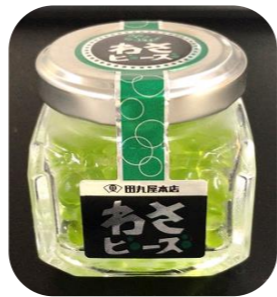
キラキラわさびはSNSでも話題です

明治8年の創業以来、わさび漬や根わさび、わさびふりかけやドレッシングで知られる老舗のわさび店「田丸屋本店」が「料理をもっと華やかに キラキラわさび」をコンセプトに開発しました。もともと展開していた業務用から、一般用に販売を開始した直後から反響が大きく、一時は供給が間に合わない状態だった逸品。イクラの軍艦や海鮮丼に乗せるのはもちろん、カルパッチョやローストビーフにちりばめたり、料理の楽しみ方が広がります。