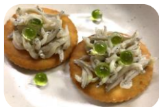
↑静岡県産のしらすとパーティーの一品に☆