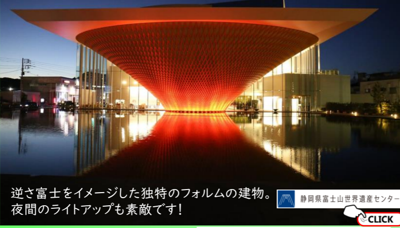
逆さ富士をイメージした独特のフォルムの建物。夜間のライトアップも素敵です!