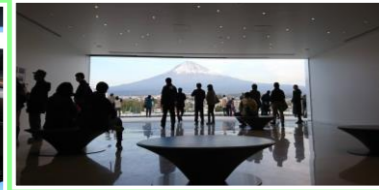
富士山を一望できる最上階の展望ホール。記念撮影に最適です。