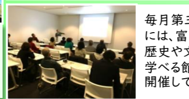
毎月第三日曜日には、富士山の歴史や文化を学べる館内講座も開催しています。

場所：富士宮市宮町5-12 (富士宮駅徒歩8分) 開館時間：通常9:00~17:00 (7,8月は9:00~18:00) 休館日：毎月第三火曜日、施設点検日