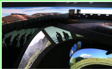
巨大ならせんスロープに沿って、四季折々の映像を楽しみながら富士登山を疑似体験することができます。