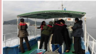
清水港では船上視察。