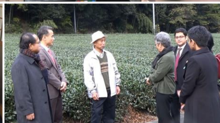
自園自製の森内農園で静岡の茶文化を知ってもらいました。