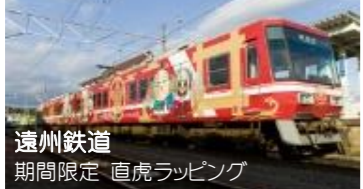
遠州鉄道 期間限定「直虎ラッピング」