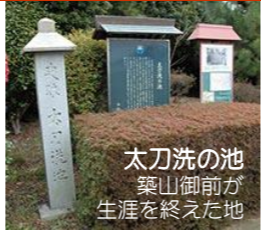
太刀洗の池 築山御前が 生涯を終えた地

ふじのくに領事館では、1年間「直虎」を中心に観光PRを行ってきました。今年、関西地域から沢山の方が静岡県西部地域を訪れてくれました。どうもありがとうございました。毎回、ドラマの終了時に紹介されてきた「ゆかりの地」に興味を持った方も多いと思います。最終回の盛り上がりを迎えるこの時期に「ゆかりの地」めぐりをして、ドラマの感動をもう一度思い起こしてみるのはいかがでしょうか？「ゆかりの地」を紹介しているパンフレットもありますので、『井伊直虎ガイドブック』で検索してください。なお、大河ドラマ館は、来年1月14日(日)までオープンしています。