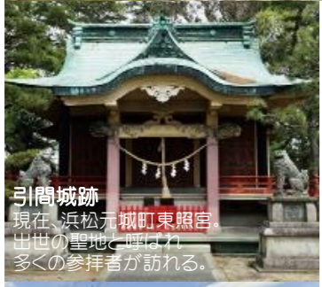
引間城跡 現在、浜松元城町東照宮 出世の聖地と呼ばれ 多くの参拝者が訪れる。