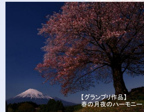
【グランプリ作品】 春の月夜のハーモニー

静岡県「富士市」からの絶景富士山を収めた第19回富士山百景写真コンテスト入賞作品が展示されます。