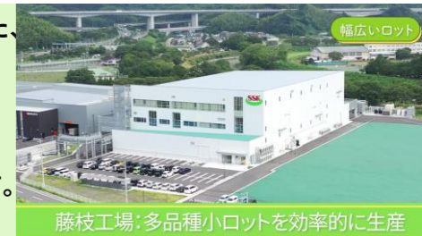
藤枝工場：多品種小ロットを効率的に生産

藤枝市の「内陸フロンティアパーク『藤枝たかた』」に2022年に稼働させた、最新鋭の調味料工場です。機械化・自動化を徹底し、先進的省人化を実現させることで「多品種小ロット」を高い生産性で製造しています。2023年には、在阪の外国総領事等をお招きし、視察していただきました。体験型学習施設「ベジマロサラダラボ」を併設し、地元の小学生たちに工場見学を通じて「食への関心」を楽しみながら学べる環境を整えています。2023年には、約1,000名の小学生が来場してくれました。