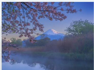
グランプリ「花めく川霧」

静岡県「富士市」からの絶景富士山を収めた第18回富士山百景写真コンテスト入賞作品が展示されます。