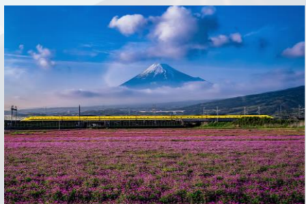
入選「蓮華畑を駆け抜けて」