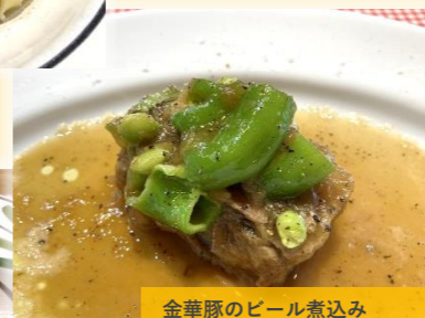
金華豚のビール煮込み