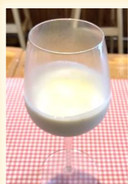
新じゃがのつめたいスープ