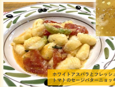
ホワイトアスパラとフレッシュ トマトのセージバターニョッキ