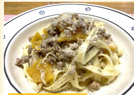
もち豚・鶏・バターナッツ カボチャの煮込みパスタ