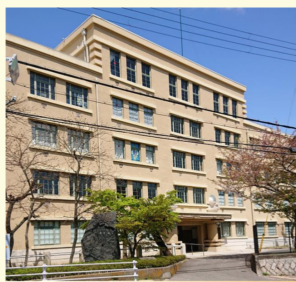
海外移住と文化の交流センター(旧国立移民収容所)