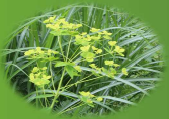
フジタイゲキ 富士山の名前を冠した静岡県のみに見られる トウダイグサ科の植物で、茶草場に自生する絶滅危惧種。