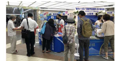
6/17、18の在阪関東ブロック連絡協議会 観光展(神戸市さんちか)の様子