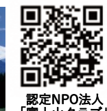
認定NPO法人 「富士山クラブ」

皆様からのご意見、ご感想、関西地域での新しい静岡情報をお待ちしております。 TEL：06-6263-6120 FAX：06-6263-6110 メールアドレス：osaka@pref.shizuoka.lg.jp