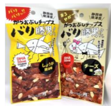
しょうが醤油(左) チーズ(右)

<大阪> ルクア大阪店 地下2F キッチン&マーケット (TEL: 06-6151-2674) ※令和3年9月16日時点での情報です。状況により入荷しない場合もございます。