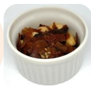
おやつやおつまみに！

お取り寄せも可能です！ https://sealuck.shop-pro.jp/