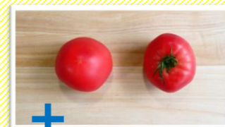
まぐろ サラダ菜 ドレッシング

品質の高さと、大玉、中玉、ミニ、高糖度トマトなど種類が多さが特徴です。サラダの他、煮込み料理などにも適しています。