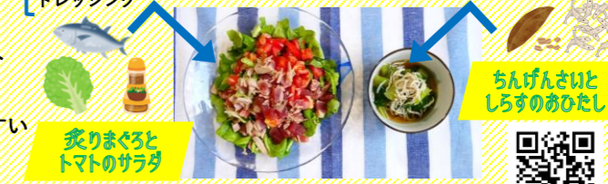
炙りまぐろと トマトのサラダ

【主な種類】 アメラ (静岡市駿河区) 果物のように甘い最高品質の高糖度トマト 枝完熟マキノハニー (牧之原市) 枝で完熟させ収穫。皮も柔らかく食べやすい 夢咲トマト (菊川市) 県内最大の産地で高品質な大玉トマト