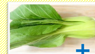
釜揚げしらす かつお節

【主な種類】 アメラ (静岡市駿河区) 果物のように甘い最高品質の高糖度トマト 枝完熟マキノハニー (牧之原市) 枝で完熟させ収穫。皮も柔らかく食べやすい 夢咲トマト (菊川市) 県内最大の産地で高品質な大玉トマト