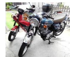
静岡に放置された愛車は、いつ復活するのか???

皆様からのご意見、ご感想、関西地域での新しい静岡情報をお待ちしております。 TEL: 06-6263-6120 FAX: 06-6263-6110 メールアドレス: osaka@pref.shizuoka.lg.jp