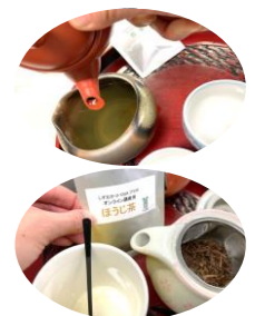
質問タイムあります☆

当日は、Zoomを利用し受講します。まずはお勉強タイムから! 講師の先生が静岡茶の歴史や産地、種類などを簡単にわかりやすく教えてくれます。続いて、「おいしいお茶の淹れ方」実践! カメラで手元を映しながら、手順を区切って説明、こちらの進み具合を確認しながら進めてくれるので、安心です! 1、2煎目の飲み比べや、ほうじ茶は「ハニージンジャーティ」に変身します!