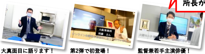
大真面目に語ります! 第2弾で初登場! 監督兼若手主演俳優!

この動画を多くの人に見ていただき、 大阪事務所のことをより身近に感じてもらいたいです。 これからもYouTubeを活用して、 関西と静岡に縁のある情報を発信していきます。