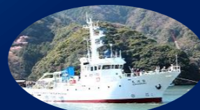
←4代目「駿河丸」 25年の活動を経て 5代目にバトンタッチ

駿河丸が所属する県水産・海洋技術研究所では、サバ・サクラエビ等の資源・生態の研究やそれらの分布・回遊に関する水温、海流等の海洋環境を明らかにする研究を行っています。