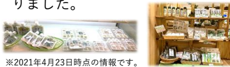
※2021年4月23日時点の情報です。