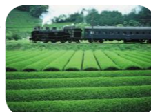
こだわりの材料「川根茶」