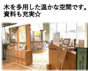
木を多用した温かな空間です。 資料も充実☆