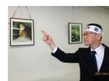
見つめる先には常に希望の光が! (イレーヌ嬢では、ありません)

今回も真剣に「見てもらえる映像」を目指します! 本編の後には番外編も! 現在、鋭意制作中です。