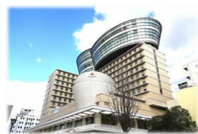
ふるさとセンターは、静岡県 大阪事務所から徒歩13分。

NPO法人ふるさと回帰支援センターの「移住したい都道府県ランキング(2020年)」で静岡県が堂々の一位に!! 同センター関西拠点の「大阪ふるさと暮らし情報センター」取材しました。