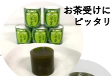
お茶受けに ピッタリ!