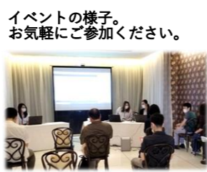
イベントの様子。 お気軽にご参加ください。