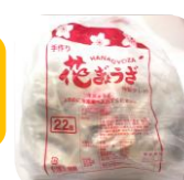
冷凍で届く生餃子

浜松と言えば「浜松餃子」。浜松に住む友人からおすめめの餃子を知り、取り寄せてみました! 地元で愛される「花ぎょうざ」は、森町の「ふるさと納税」の返礼品にも選ばれる程人気だそうです。皮はもちっとカリッと! 野菜がたっぷり入ってジューシーあっさりしていて、何個でも食べられます!ビールに合いますよ!