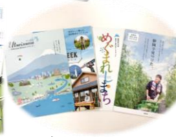
各種パンフレット