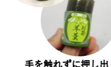
手を触れずに押し出し

茶処静岡の中でも、高級なお茶の産地として名高い川根。今でもSLが走り、まるでタイムスリップでもしたような景観の中、大切に育てられた緑茶を練り込んだ筒型の羊羹が、今回紹介する「お茶羊羹」です。川根茶独特の風味と羊羹の甘さのバランスがとても良く、日本人に古くから受け継がれてきた味覚を呼び覚ましてくれるような逸品です。