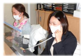
電話相談もお気軽に。 真剣かつ丁寧な対応が印象的!