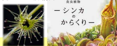
食虫植物 —シンカからくり—