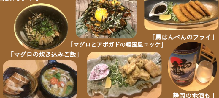
「黒はんぺんのフライ」 「マグロとアボガドの韓国風ユッケ」 「マグロの焼き込みご飯」 「マグロテールのアヒージョ」「びんころの唐揚げしばづけタルタル」 静岡の地酒も!