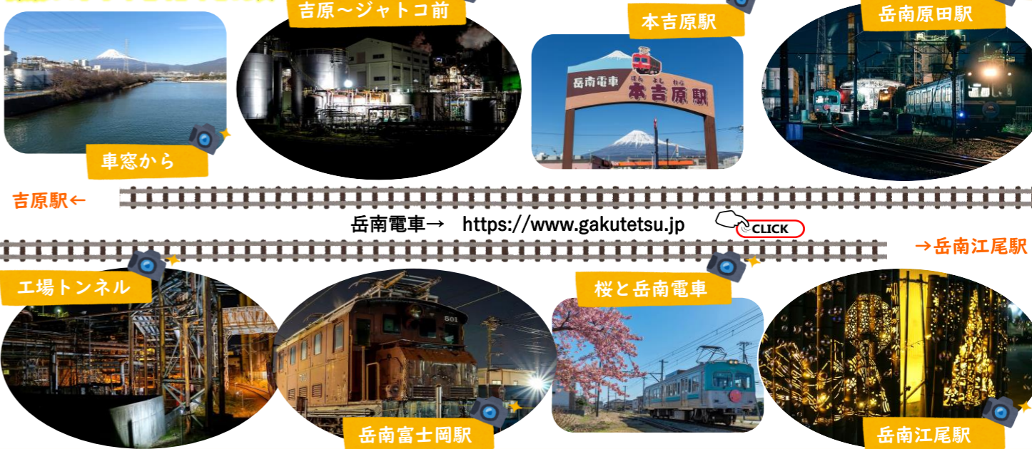
吉原~ジャココ前 本吉原駅 岳南原田駅 吉原駅← 岳南電車 → https://www.gakutetsu.jp 工場トンネル 桜と岳南電車 岳南富士岡駅 岳南江尾駅