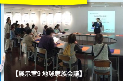
【展示室9 地球家族会議】

インタープリターと来館者が「地球の環境リスクと豊かなくらしのヒント」を話し合う、当館ならではの思考型展示です。