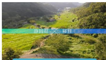
静岡移住 テレワーク

自然に囲まれた移住先は、刺激も癒しもある場所です。静岡に来てから、家族や生活、心のゆとりもできました。