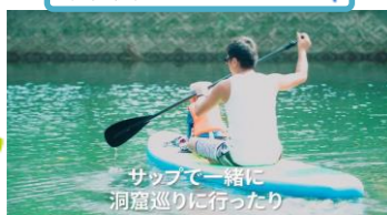
サップと一緒に洞窟巡りに行ったり