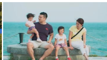
すごい幸せだなと思います