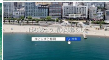
はじめての静岡暮らし