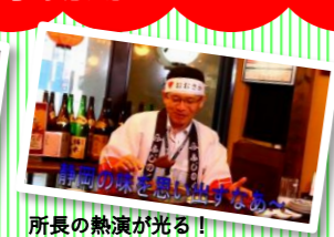
所長の熱演が光る!!