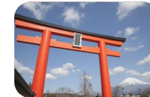
富士山と浅間大社は「あこがれ」