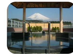
温泉でのんびり癒されたい!