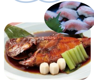
金目鯛でお酒が進む・・・