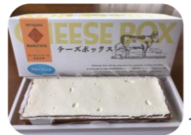
冷凍→冷蔵庫で解凍