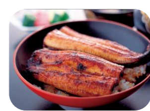
想い出の絶品「うなぎ」