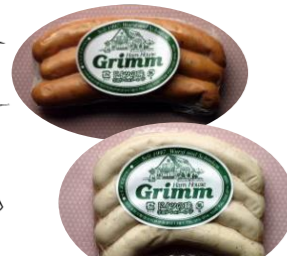
ビールが止まらない・・・

HP ( http://grimm-1.jp/ ) に各商品のご案内があります。ご注文はFAXをお願いします!