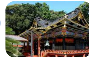
久能山と日光、家康はどちらに?