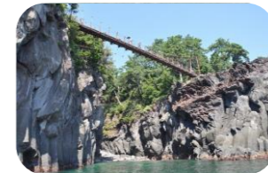
伊豆の絶景が見てみたい!