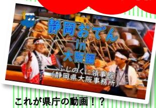
これが県庁の動画!!?