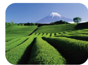
茶畑と富士山!美しい☆