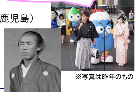
※写真は昨年のももの

11月15日は坂本龍馬の命日。その直前の週末に龍馬ゆかりの7県(静岡、広島、山口、高知、佐賀、長崎、鹿児島)の大阪事務所で結成する「大龍馬恋(だりょうまれん)」が、幕末の志士が活躍した京都の地で各県の魅力をPRする観光展を開催します。