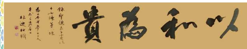
日本平夢テラス「以和為貴」

展覧会: 第64回現代書道二十人展 日時: 令和2年1月9日 (木) ~ 14日 (火) 場所: 大阪高島屋 (大阪市中央区難波5-1-5) ※東京 (日本橋高島屋)、名古屋 (松坂屋美術館) でも開催されます。この機会にぜひ、郷土を代表する巨匠の作品をご覧ください。