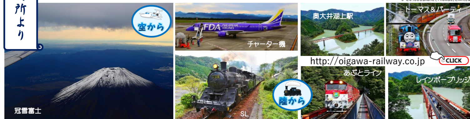
写真はツアーに参加された「ふじのくに通信」読者の方からご提供いただきました。