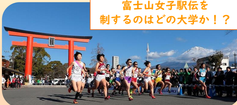
※大会当日の富士山が見られる確率は約80% (富士市役所過去10年データより)