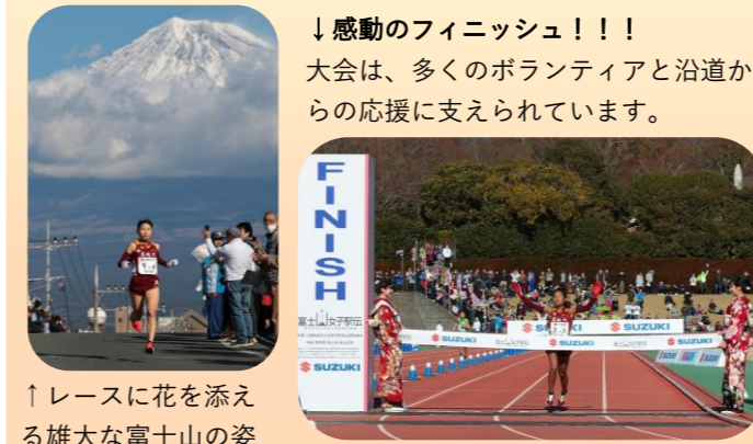
↑レースに花を添える雄大な富士山の姿

日本一を競う「富士山女子駅伝」は、7区間全長43.4km。「富士山本宮浅間大社」(富士宮市) をスタートし、ゴールの「富士総合運動公園陸上競技場」(富士市) を結ぶ、高低差172mに及ぶ起伏に富んだコースで、7人のランナーがたすきをつなぎます。