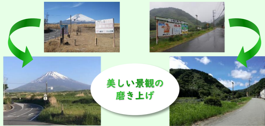
美しい景観の磨き上げ

東京2020オリンピック・パラリンピックの自転車競技が、静岡県で開催されます。現在、競技大会となる伊豆半島や富士山周辺のロードレースコース、さらには県内全市町と連携して、集中的な違反広告物対策に取り組み、美しい景観づくりを推進しています。