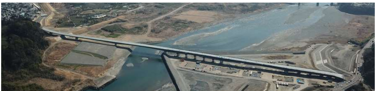
⑥完了 (R2.11月~R3.5月 R3.11月~R4.5月) 架設工事を2期に分けて実施