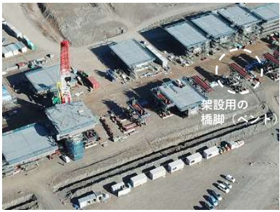
④現場で桁を組み立て