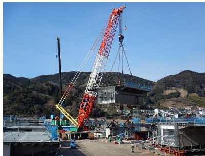
⑤クレーンで架設(ボルト締め)