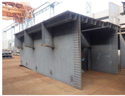
②工場内で桁を組み立て