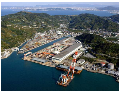
①国内3工場では桁を製作

橋桁は7径間連続鋼床版箱桁構造を採用。コンクリートと比較して軽量の鋼材による橋桁。橋桁の架設には、国内に20台程度しかない750t吊クローラークレーンを使用。