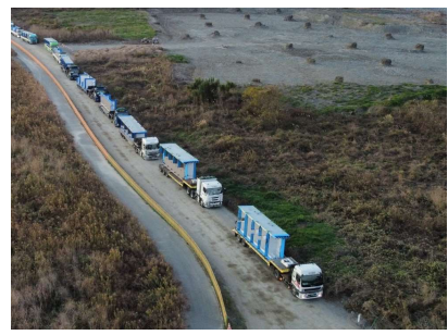
③桁を分解し現場へ搬入