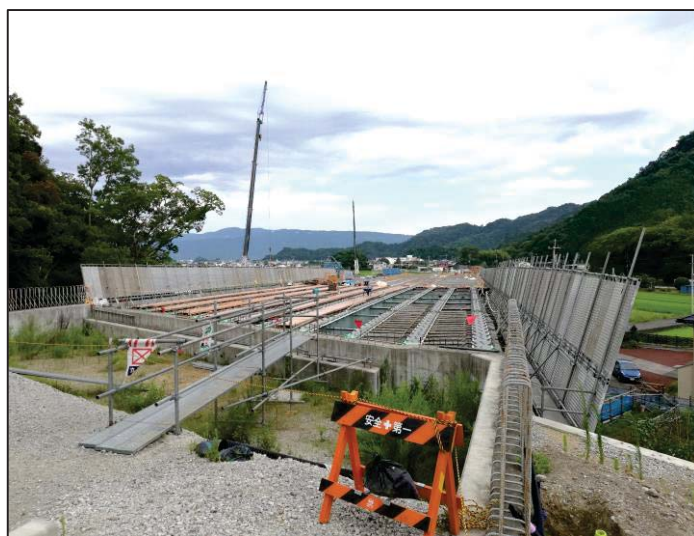
▲ 現場の高架橋の架設状況