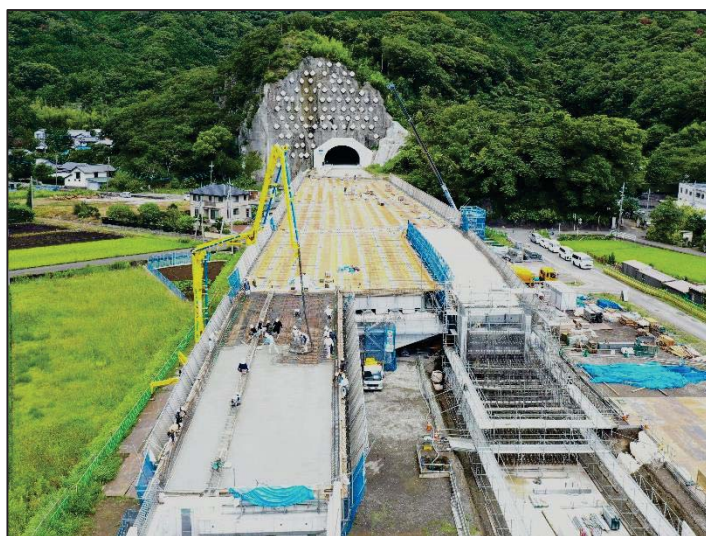
▲ ドローンで見た高架橋の架設状況