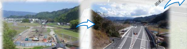
トンネル坑口から沼津大平ICの眺めの変化