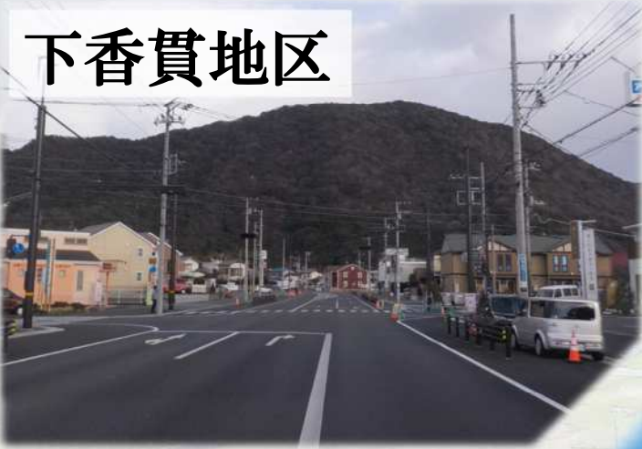
下香貫側トンネル坑口付近の眺めの変化