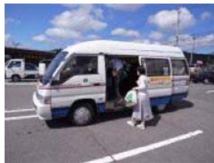
(デマンド型交通 (ワゴン車))