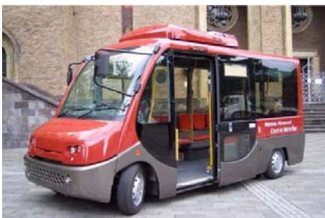
(デマンド型交通 (バス))