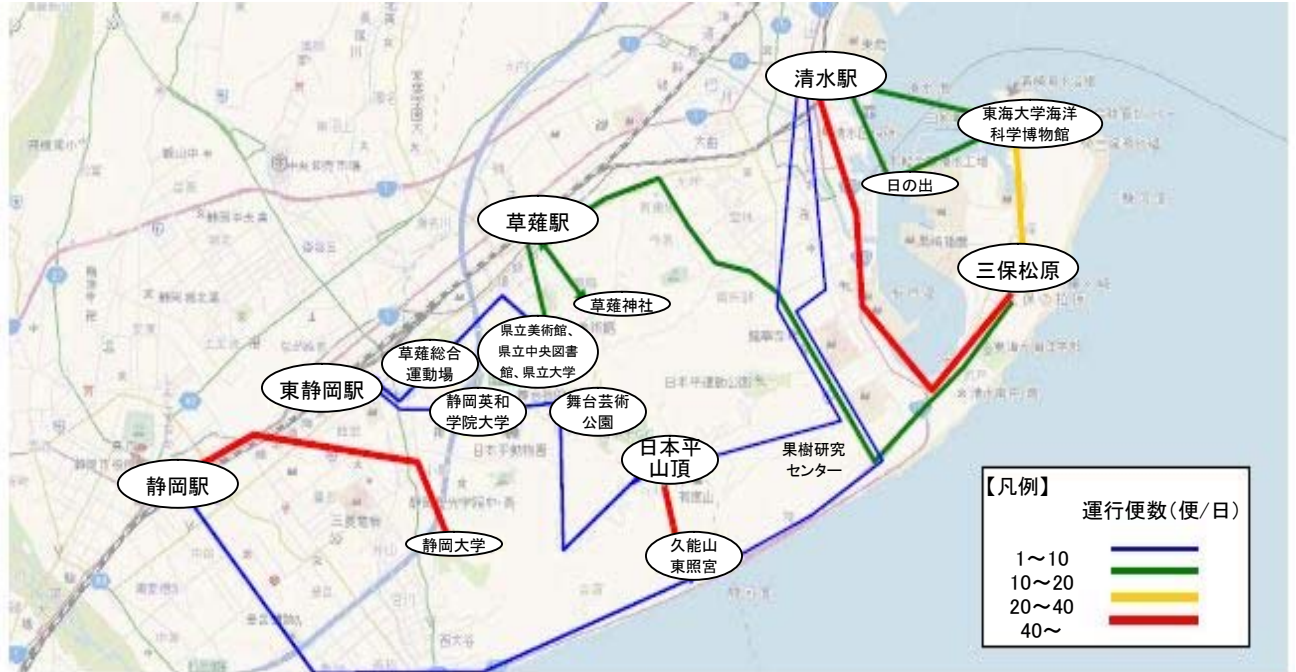
図7：東静岡駅周辺から日本平、三保松原に広がる地域の公共交通網