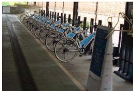
(レンタル自転車ステーション)