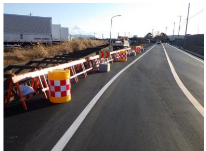
② 迂回路を北より望む