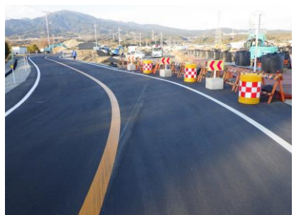
① 迂回路を南より望む