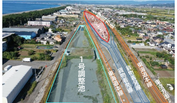
新貨物ターミナル東側から撮影(R6.12月撮影)