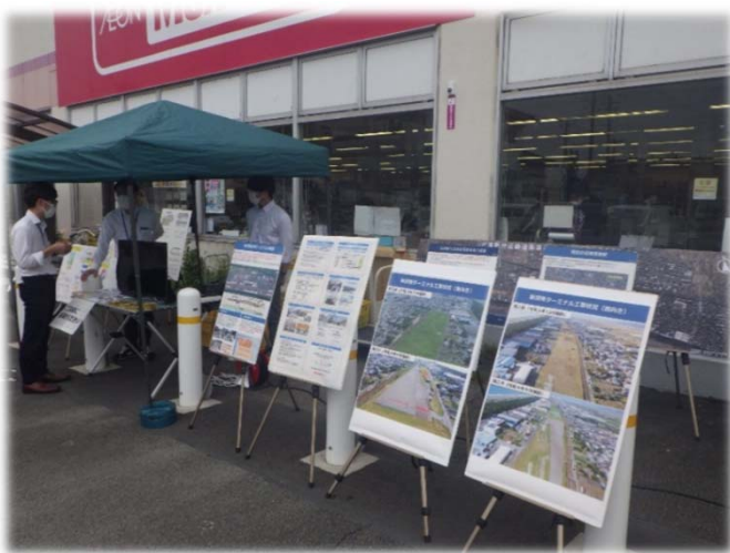
「マックスバリュ沼津原町西店」

今年度2回目となった「原地区まちかどトーク」では、新貨物ターミナルの現在の工事進捗について新たにパネルを作成しました。来場者からは新貨物ターミナルの整備に関する質問を数多く頂きました。