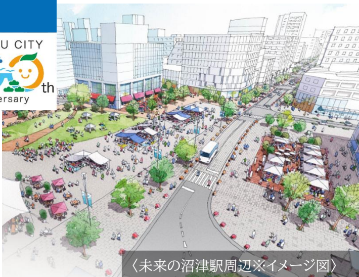
<未来の沼津駅周辺※イメージ図>