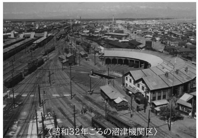
〈昭和32年ごろの沼津機関区〉

沼津市誕生の34年前の明治22年に開業した沼津駅は、箱根越えを控えた立地上、転車台や扇形庫を備えた車両基地や貨物操車場などが併設された広大なターミナルでした。