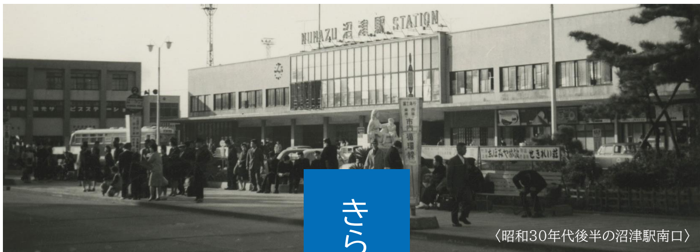
<昭和30年代後半の沼津駅南口>

<今月の1枚> 沼津の夏の風物詩といえば 狩野川花火大会。今年も沼津 の夏の夜空を彩ります。