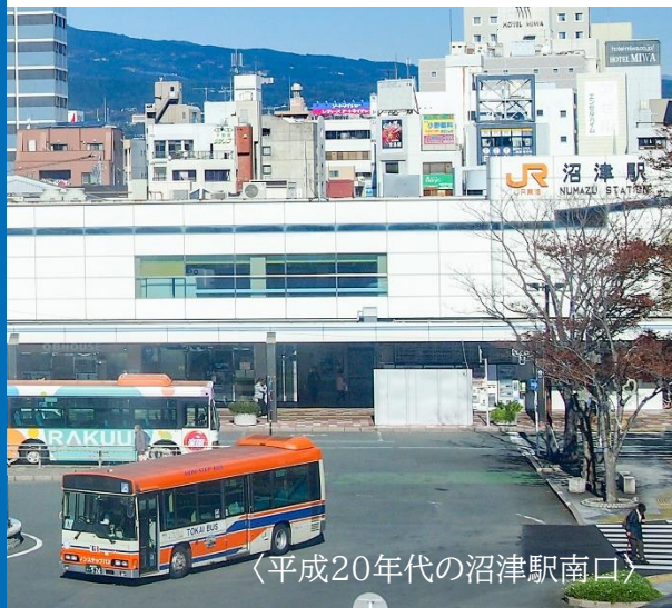
<平成20年代の沼津駅南口>