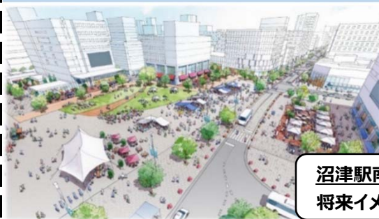
沼津駅南口広場の将来イメージ

沼津駅周辺の市街地をヒト中心の魅力ある場所へと再生し、多くの市民や来訪者が集い、交流し、住まい、回遊する都市の顔として再構築していくために、今後の沼津駅周辺総合整備事業の本格展開と併せて実施すべき、「まちづくりの施策の方向性」を示すことを目的とした戦略です。（沼津市HP転載）