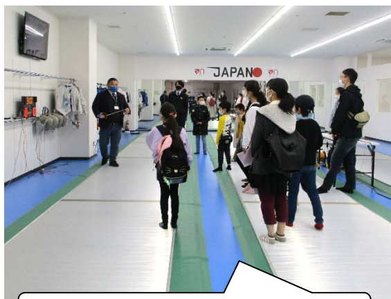
フェンシングの競技台（ピスト）に乗れた！

プラサヴェルデでは、鉄道高架後のイメージ模型やコンベンションホールを見学しました。昨年BiVi沼津にオープンしたフェンシング練習場のF3BASEでは、フェンシングのサーブルやマスクに触る体験をしました。JR貨物沼津駅では、コンテナに入ったり、機関車を間近に見学することができました。参加者からは「機関車を近くで見られて楽しかった」等の声を聞きました。