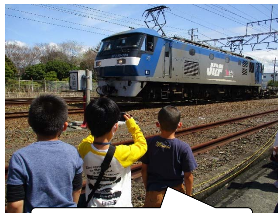
こんなに近くで機関車を見られた！